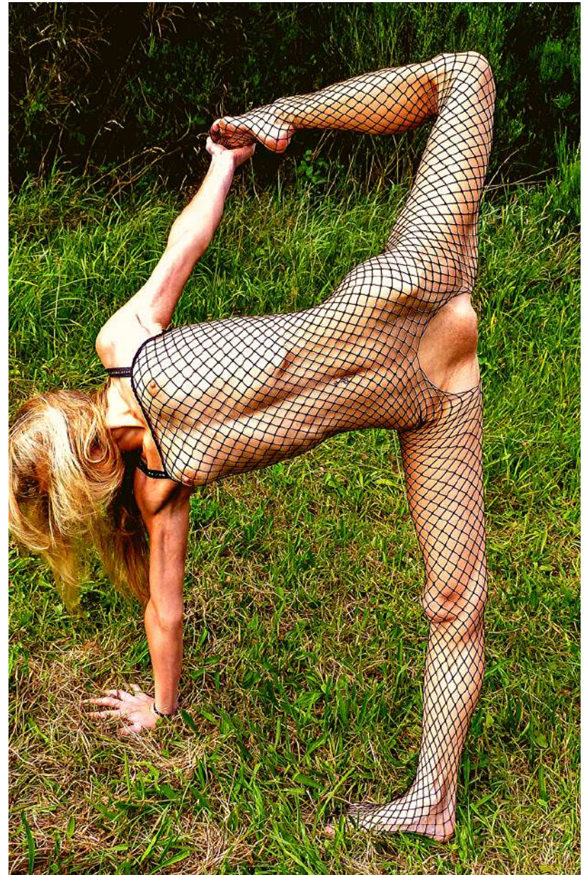
fig. 5 Spagat im Stehen