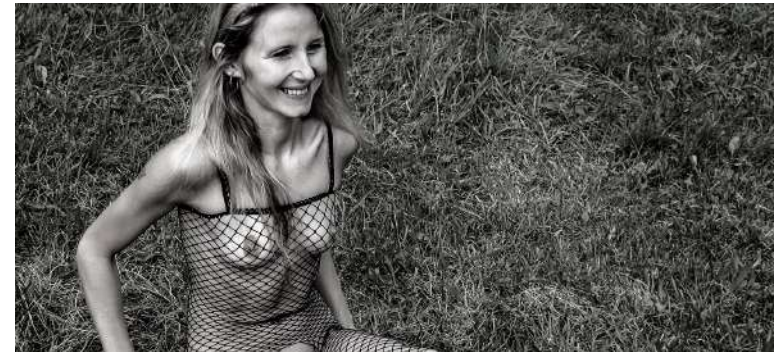
fig. 8 Open Sky