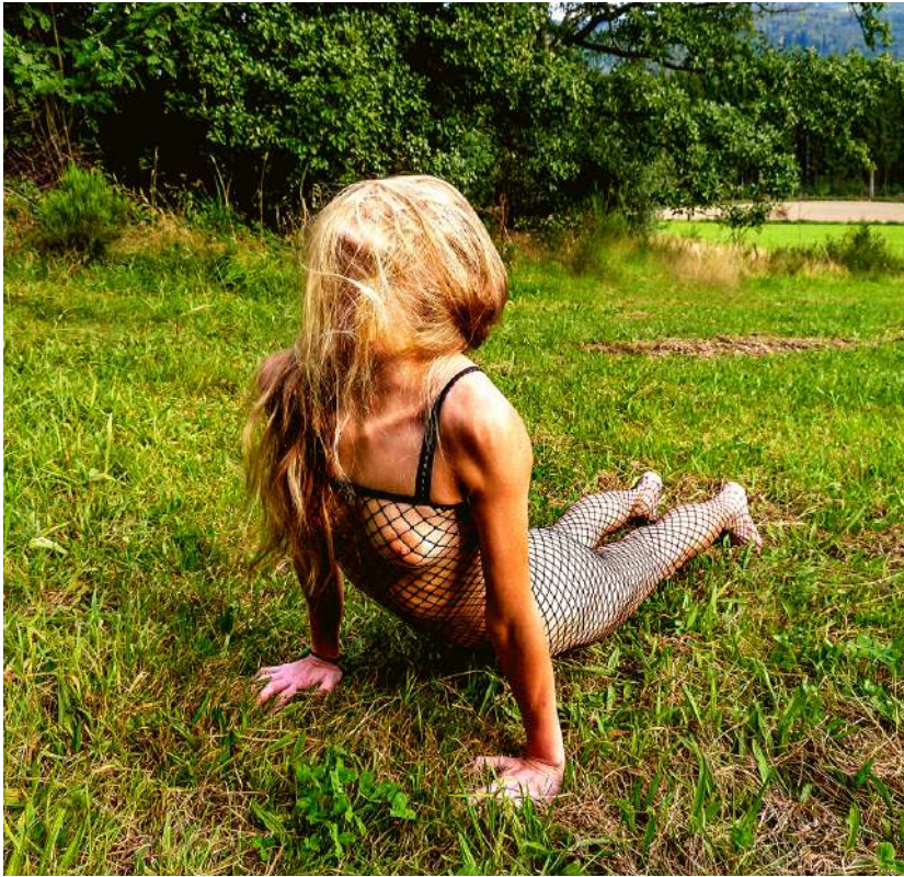
fig. 7 Heraufschauender Hund